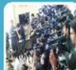
สื่อมวลชน