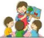
เด็กและเยาวชน