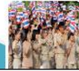
เจ้าหน้าที่ของรัฐ

สร้างและปลูกจิตสำนึกกลุ่มเป้าหมายทุกกลุ่ม ด้วยการใช้หลักสูตร การใช้สื่อรณรงค์ การ อบรม และเทคนิคการสื่อสารเพื่อการ เปลี่ยนแปลง