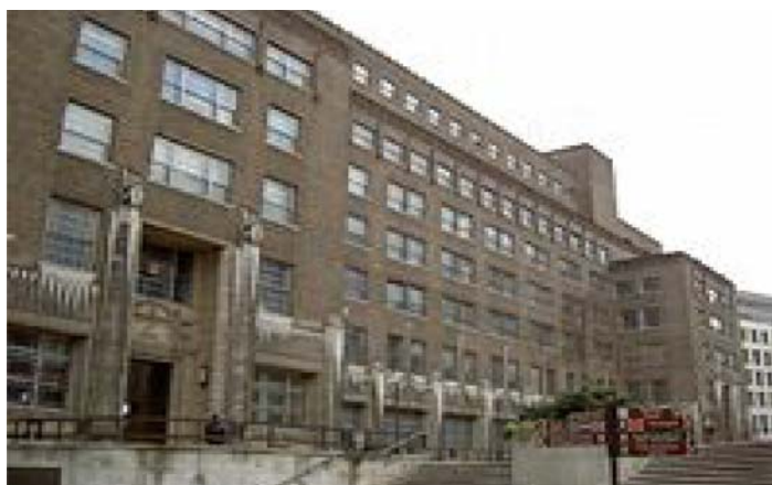
ภาพด้านเหนือของตึก Guildhall ซึ่งเป็นที่ตั้งของสำนักงานส่วนใหญ่ของ City of London

ทุกวันนี้ City of London เป็นองค์กรที่ปลอดพรรคการเมือง การเลือกตั้งใช้วิธีแบบดั้งเดิม เมื่อพิจารณาในหลายๆ ด้านแล้ว จะเห็นว่า the Corporation หรือ City of London เป็นองค์กรประวัติศาสตร์ ที่มีชีวิต และมีเอกลักษณ์ของตนเอง