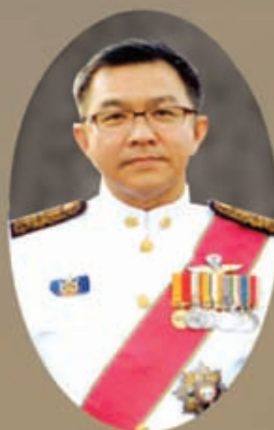
นายวิสาร เตชะธีราวัฒน์ รัฐมนตรีช่วยว่าการกระทรวงมหาดไทย

หมายเหตุ - พลตำรวจโท ชัจจ์ กุลดิลก รัฐมนตรีช่วยว่าการกระทรวงมหาดไทย ดำรงตำแหน่งวันที่ ๒๘ ตุลาคม พ.ศ. ๒๕๕๕ ถึงวันที่ ๓๐ มิถุนายน พ.ศ. ๒๕๕๖ - นายวิสาร เตชะธีราวัฒน์ รัฐมนตรีช่วยว่าการกระทรวงมหาดไทย ดำรงตำแหน่งวันที่ ๓๐ มิถุนายน พ.ศ. ๒๕๕๖ ถึงปัจจุบัน