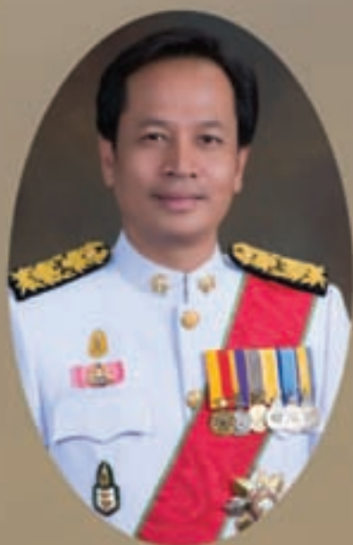
นายประชา ประสพดี รัฐมนตรีช่วยว่าการกระทรวงมหาดไทย