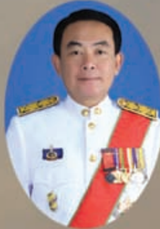
นายประภาศ บุญยินดี รองปลัดกระทรวงมหาดไทย