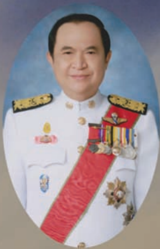
นายจรุพงศ์ เรืองสุวรรณ รัฐมนตรีว่าการกระทรวงมหาดไทย