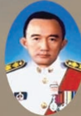
หม่อมหลวงปนัดดา ดิศกุล รองปลัดกระทรวงมหาดไทย