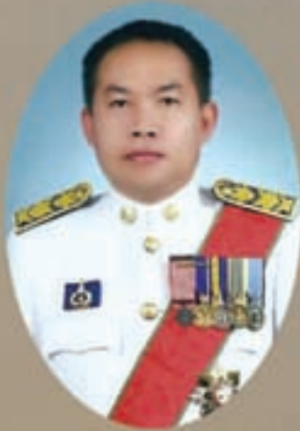
นายภาณุ อุทัยรัตน์ รองปลัดกระทรวงมหาดไทย