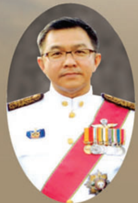
นายวิสาร เตชะธีราวัฒน์ รัฐมนตรีช่วยว่าการกระทรวงมหาดไทย