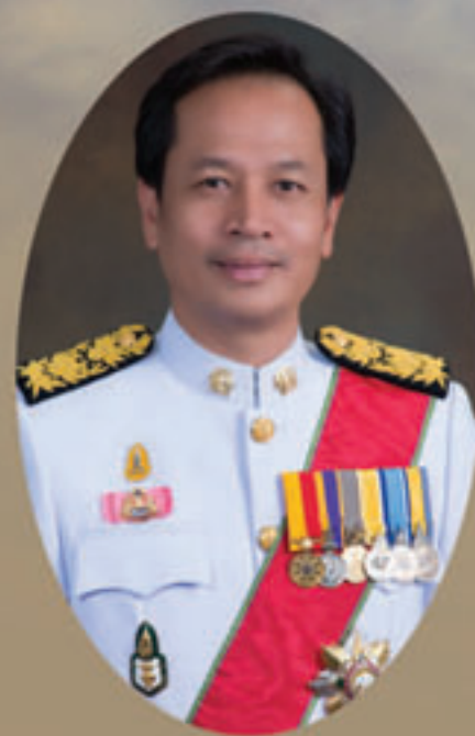
นายประสา ประสพดี รัฐมนตรีช่วยว่าการกระทรวงมหาดไทย