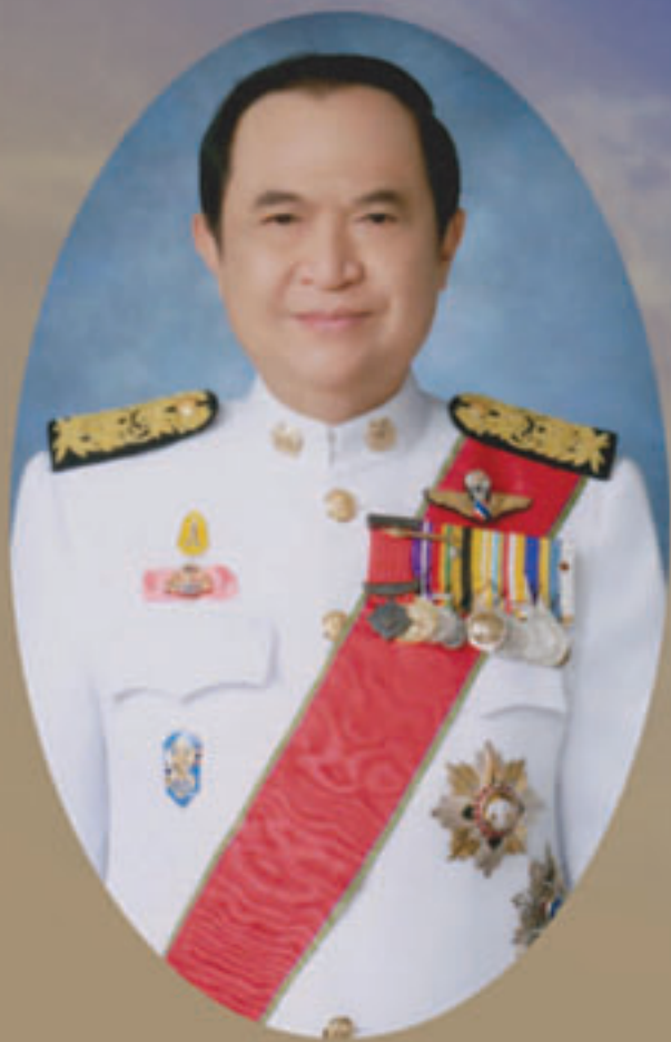
นายjarungki เรืองสุวรรณ รัฐมนตรีว่าการกระทรวงมหาดไทย