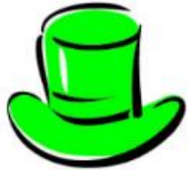
Green Hat Creativity