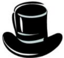
Black Hat Cautions