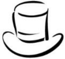
White Hat Facts