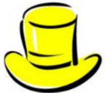
Yellow Hat Benefits