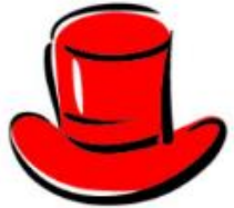
Red Hat Feelings