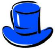
Blue Hat Process